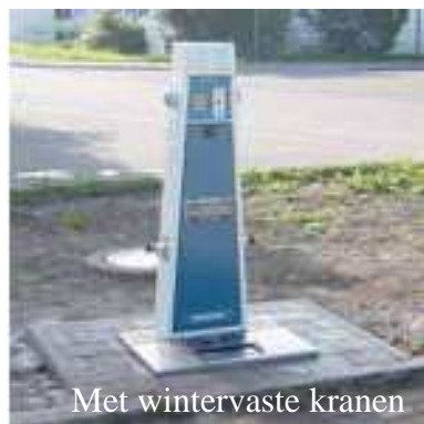
Met wintervaste kranen