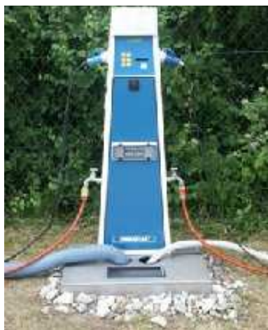
Met zomer kranen

Edelstalen onderstel met afvoerput, afdekplaat met 2 x 3" slanginvoer en deksel voor cassettes.